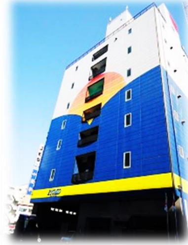
江戸川区臨海町4-2-2 菱幸ビル